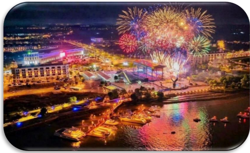
Pháo hoa rực rỡ tại Quảng trường Aqua City

Tối 18/05/2026, Aqua City vinh dự trở thành địa điểm tổ chức Lễ công bố Nghị quyết của Quốc hội về việc thành lập thành phố Đồng Nai trực thuộc Trung ương và đón nhận Huân chương Lao động hạng Nhất – dấu mốc quan trọng mở ra kỷ nguyên phát triển mới của TP. Đồng Nai.